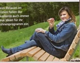
Beim Relaxen im Grünen fallen der Musikerin auch immer neue Ideen für ihr Bühnenprogramm ein