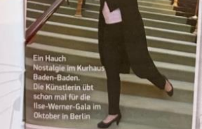
Ein Hauch Nostalgie im Kurhaus Baden-Baden. Die Künstlerin übt schon mal für die Ilse-Werner-Gala im Oktober in Berlin