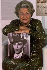
Unvergessen Ilse Werner (1921–2005) verzauberte die Menschen mit ihren Schlagen und als Kunstpfeiferin